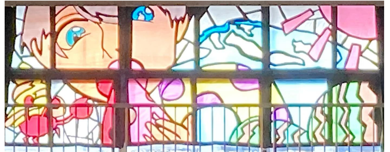
2-5 部活動 (体育館)