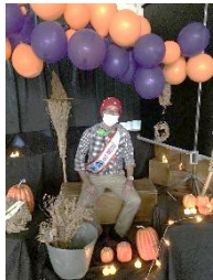
▲映えスポットで記念撮影