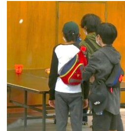
▲新記録達成なるか??