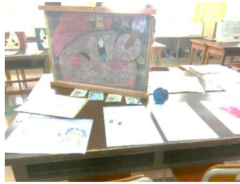
▲美術部、文芸部の展示