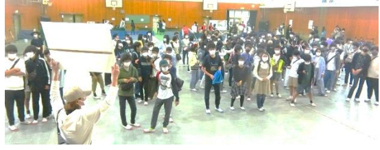
▲〇×クイズ。豪華な景品がたくさん