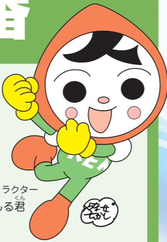
じんけん 人権イメージキャラクター じん 人KENまもる君

ど よう び にち よう び しゅく じつ へい じつ じ かん がい ※土曜日、日曜日、祝日、平日の時間外は 留守番電話です。