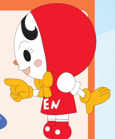
じんけん 人権イメージキャラクター じん 人KENあゆみちゃん