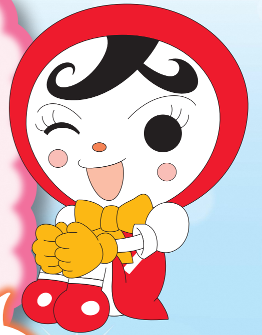
じんけん 人権イメージキャラクター じん 人KENあゆみちゃん