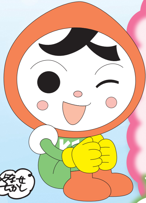
じんけん 人権イメージキャラクター じん 人KENまもる君