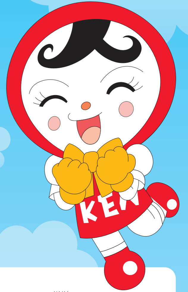
じんけん 人権イメージキャラクター じん 人KENまもる君