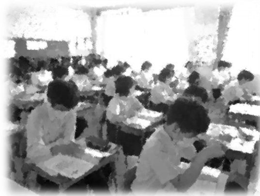
家庭科ではファッションコーディネートの勉強をしていました