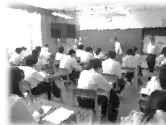
数学も2年生になって少しずつ難しくなってきましたか？