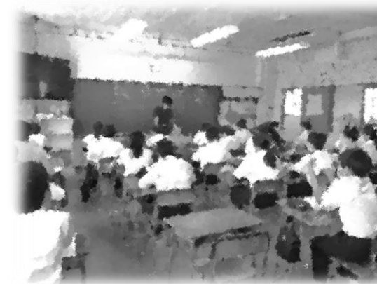
社会の授業は災害の話かな？