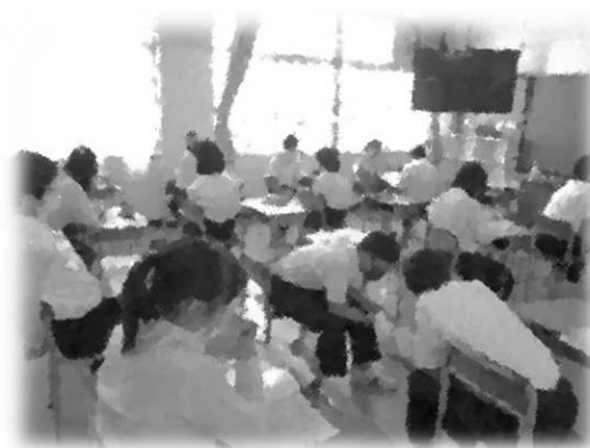
英語の単語テストに向けてペアワーク中！