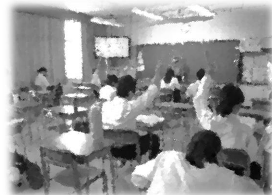
AETのエラ先生と、英単語でビンゴ♪