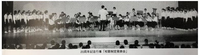
20周年記念行事「校歌制定発表会」

校歌の歌詞に込められた想いは、まず一番で、学問の場である学校において、真理の探究に情熱を燃やす若人の姿を描き、二番で、校章のひまわりに象徴されるように、みんなが