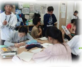
班のみんなで協力して・・・