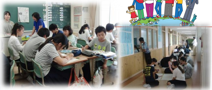
班で決めた国を本やネットで調べまとめました。