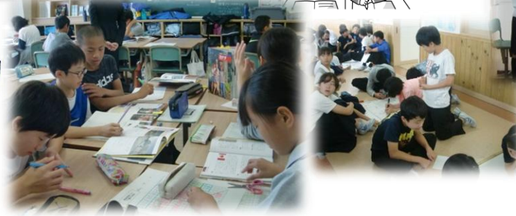
現在、最後の仕上げをしています。