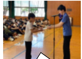
生徒会長から表彰状を渡されました