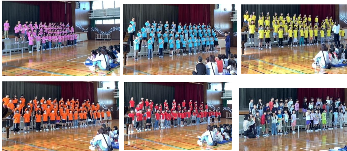
カラー版はホームページをご覧ください

One for all ,all for one… We will be reborn !