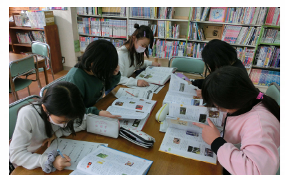
【休み時間にもハテナシートに挑戦する4年生】

「図書の時間」に、3年生から6年生まで百科事典の使い方を勉強しました。「五十音順になっている」「有名な人やいろいろな物がのっている」「写真やグラフがある」など、百科事典の特ちょうをみんなで発見しました。そして、ハテナシートでわからないことを調べました。「知らない動物のことがわかった」「調べ方がわかって楽しかった」という声が聞かれました。今月、総ページ4,800ページ、収録項目は30,500項のポプラディア第三版が発行されました。「ものもらい」が写真つきで載っていてビックリ!しました。わからないことがあったら調べて、疑問を解決しましょう!