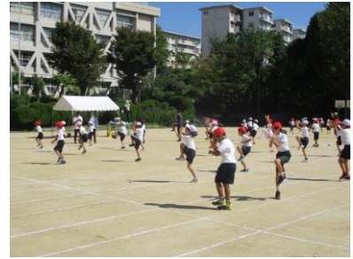
運動場、暑い・・・