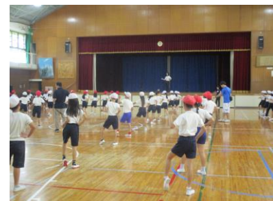
リズムに乗って、息を合わせて