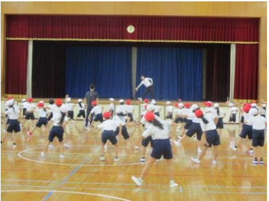
体を大きく使って・・・