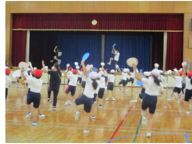
かけ声が体育館中に