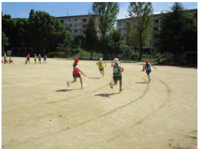
バトンパスも上達したよ