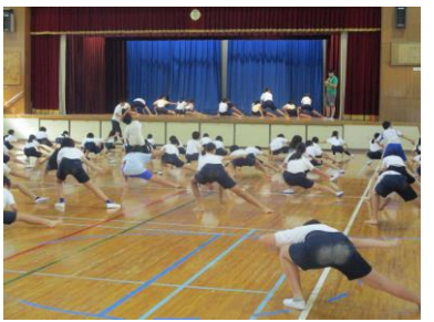
どっこいしょどっこいしょ