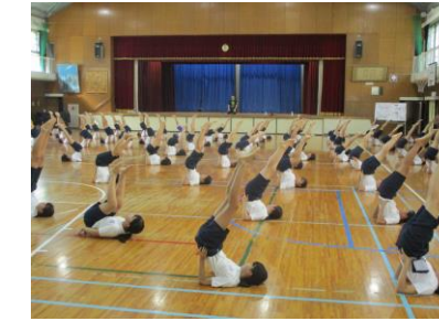
背支持倒立、揃った！！

「走」競技に、「ダンス」に、全校児童みんなが運動会に向けて練習頑張っています。 運動会当日は、ぜひお子様の晴れ姿をご覧になってください。