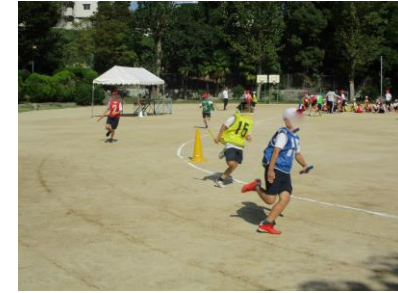
練習から白熱してます