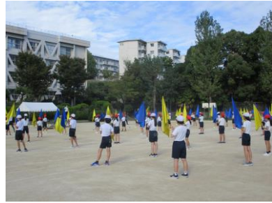
風を切り裂くフラッグ