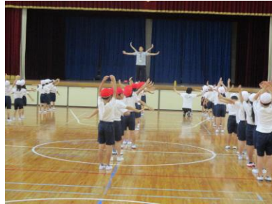
ダンス練習も頑張ります