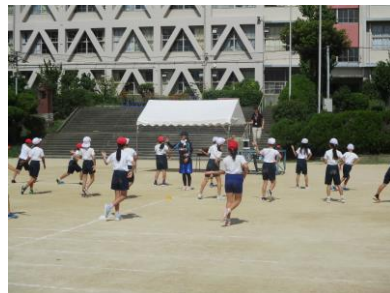
複雑な振付に戸惑う姿も