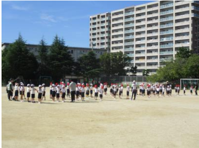
まずは並び方の練習から

10月7日(土)の運動会に向けて、どの学年もがんばっています。今年の運動会は昨年同様、 全学年で午前中実施となります。運動会前に、少しだけ練習風景をチラッと見せてみます。