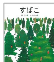
『すばこ』 キム・ファン(ほるぶ出版)