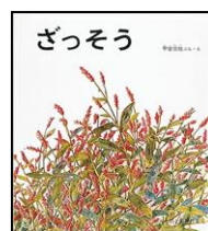
『ざっそう』 甲斐信枝／文・絵 (福音館書店)