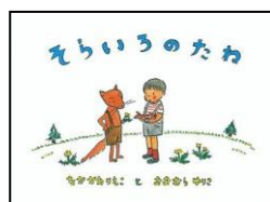
『そらいろのたね』 中川李枝子／作 大村百合子／絵 (福音館書店)