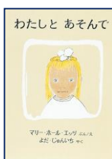
『わたしとあそんで』 マリー・ホール・エッツ (福音館書店)

あたたかな春 はる のこもれ かげ び を 感じる1さつです (ていがくねんから)