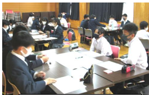
ひきつぎ会での話し合い

そして放課後には、生徒会の「引き継ぎ会」が多目的室にて行われました。これは、前期生徒会執行部から後期生徒会執行部に「生徒会活動に対する思い」や「取り組みで大事にしてほしいこと」を伝え合う取り組みです。庄内さくら学園中学校をどんな学校にしていきたいのか、そのために大切なこと、必要なこととは何なのかをグループに分かれて話し合い、発表しあうという内容で、「思い」をつないでいこうという気持ちがあふれ、柔らかな