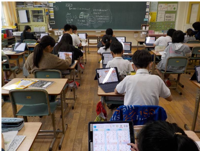
四年生社会の授業風景 四月二十八日、四年一組教室

した。タブレットを持ち帰り、家庭学習にも活用しています。万が一のためのリモート授業もできるようにと教職員が工夫して準備を進めているところです。「学びを止めず、深い学びにつながるように！」と、より効果的なタブレットを活用方法を模索しています。