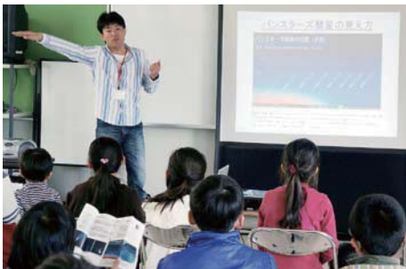
しょうじ地域子ども教室の「科学おもしろ話」