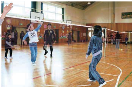
大人も子どもと一緒に楽しめるファミリーバドミントン

野球などのスポーツだったり、いろいろだよ。 小学生 そうなんだ。他の教室にも参加してみたいな。 先生 校区外の人でも参加できる教室もあるし、いろんな学年の人が参加するから、友達も増えて楽しいよ。