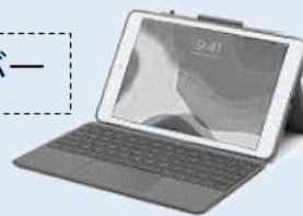
キーボードありのカバー