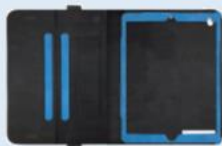
キーボードなしのカバー