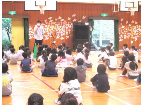
↑学年集会のようす

楽しみながらも一人ひとりが目標に向かって取り組んでいけるよう、指導していきたいと思えます。