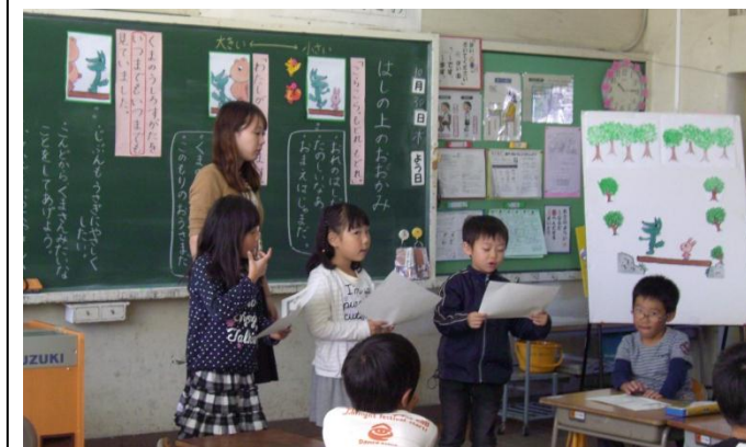
1年2組 道徳「はしのうえのおおかみ」