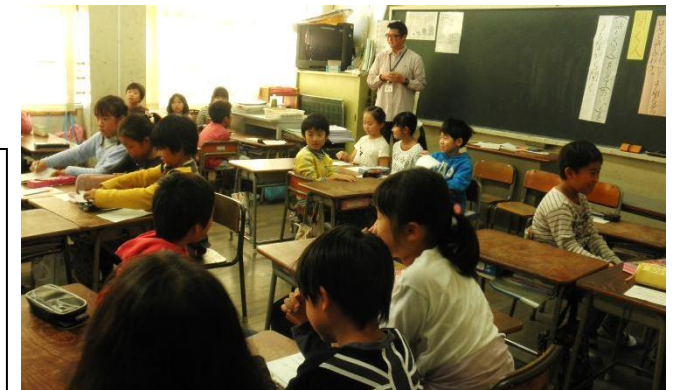
2年3組 国語「聞き合おう、みんなのたからもの」

1・2年生とも、最初は、たくさんの先生が教室に参観に来たので驚いていましたが、徐々に先生たちがいることを忘れ、のびのびと学習していました。