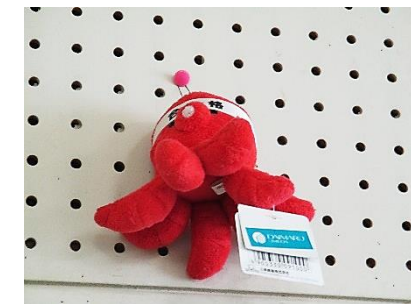
3年生の掲示物より