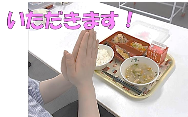
写真は豊中市教育委員会作成のイメージ映像より

以前お知らせしたように、2学期からは全員給食が始まります(8/26がスタートです)。内容は、・温かいごはん ・温かいおかず ・ランチボックス(小おかず等) ・牛乳の4点になります。給食当番や配食、片付けについては、後日具体的な説明があります。給食に必要なものとして、毎日次の2点を持ってきてください。