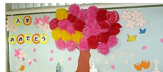
1年生教室前の壁面飾り「入学おめでとう」