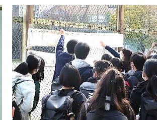
8日の朝のクラス発表(2年生)