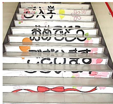
生徒作成の歓迎の「階段アート」

人の命や、人間らしく豊かに生きる権利が奪われている現実が連日報道されている今だからこそ、「人を大切にする」重さを感じていきたいです。