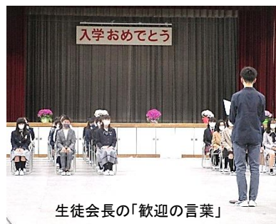
生徒会長の「歓迎の言葉」