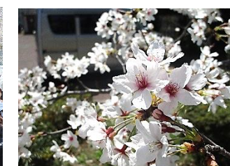
正門の坂の下の桜も満開