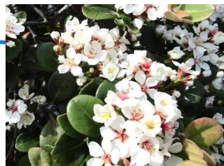
体育館横のシャリンバイ

18中生のみなさん、お元気ですか？ 先生は今、宝塚の学校で元気に先生をしています。