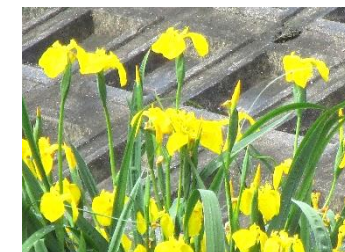
山所池のしょうぶ