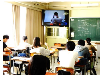
6月26日 リモート生徒集会。執行部、学年協議会、委員会の方針が伝えられました。