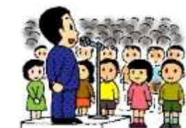
生徒会長からのことば>>