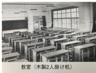
教室(木製2人掛け机)