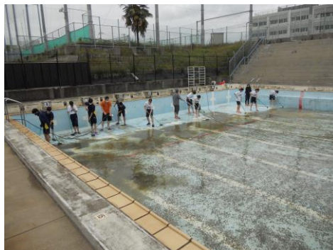
↑ プール掃除の様子

きれいな水のプールに入る時、陰で支えてくれている人がいることに感謝して入って欲しいと思います。