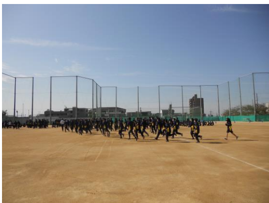
↑ 走ってグラウンドに避難している様子

ました。3年生、 2年生、1年生とも ほかひと はなし に他の人と話を すばや することなく素早 いどう く移動できていま した。とてもいい くんれん ねんせい おも 訓練になったと思 います。