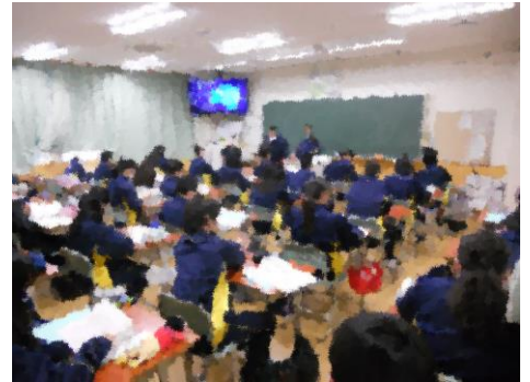
↑ 教室で話し合っている様子

執行部からの発表の中で「一中生全員が参加する生徒会活動を活発に行いたい」との話があったように、生徒会活動を生徒全員でつくっていきましょう。