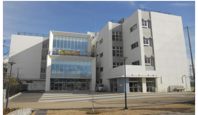
↑1月6日 青空の下の一 中校舎

2つ目は「新年の目標」についてです。「1年の計は元旦にあり」のことで、みなさんは、1月1日、元旦に「どんな1年にするのか」を決意し、「新年の目標」を決めましたか。元旦でなくても、今日までに決めた人はいいのですが、まだの人はぜひ「新年の目標」を決めてほしいと思います。