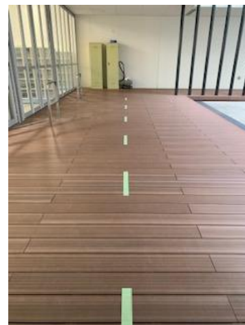
密集・密接を防ぐため みぎがわいっぽうつうこう の右側一方通行です