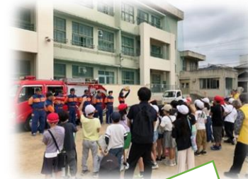
校区探検・消防団