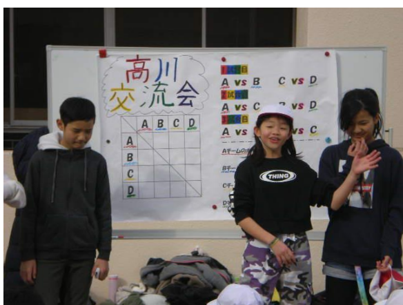
最初に説明をします

6年生は間もなく中学校へと進学します。多くの6年生は豊中12中へ行くことになります。12中では、高川小学校、小曾根小学校と一緒にになりますが、できればその子どもたちとも仲良くなりたいと、今月7日（金）、高川小学校の6年生との交流会が企画されました。（残念ながら、小曾根小学校は合流できませんでした。）交流会では、おにごっこや王様ドッジをして、楽しい時間を過ごしました。今回をきっかけにして少しでも仲良くなり、中学校へ行ってもいい友だちどうしてほしいですね。