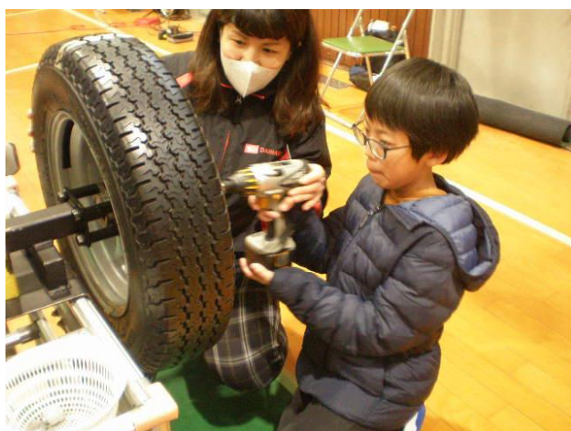
タイヤをつけてみます

今月6日（木）、自動車メーカー・ダイハツの方に来ていただき、出前授業が行われました。数人ずつの小グループに分かれ、次々とブースを回っていきます。エンジンの仕組みを教えてもらったり、どのように自動車が組み立てられていくのかを教えてもらったりと、とても分かりやすい説明でした。私も少しだけ様子を見に行きましたが、「ふ～ん、なるほど～」と、とても興味深くお話を聞かせていただきました。