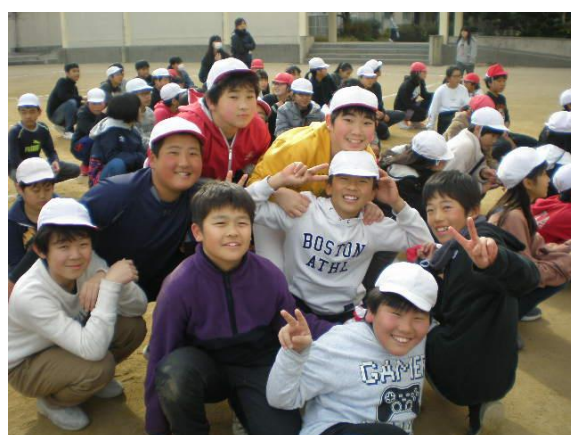
交流会前のようすです