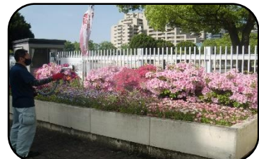
カラーで配布できないのがものすごく残念です・・・(学校HPや掲示はカラーです)