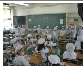
しっかりとお話を聞き・・・

いよいよ準備にとりかかり、順番を守って給食を運びました。自分の机に運んできた給食をみて、『うわ～おいしそう！』『早く食べたいな～😊』という声もちらほら聞こえ、目をキラキラさせながら給食を見つめている姿もありました。