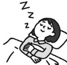
じゅうぶんな睡眠