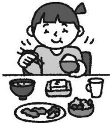
バランスのとれた食事